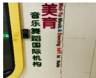
美育音乐舞蹈国际机构 拒绝原因：有专业人员进行推广