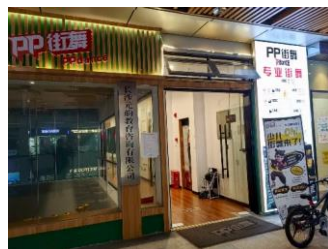
街舞 拒绝原因：更倾向与有经验的第三方机构合作