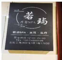
若琦美甲 拒绝原因：有专 业人员进行推广