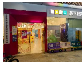
英孚教育 拒绝原因：无兴趣