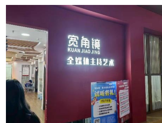
全媒体主持艺术 拒绝原因：目前不需要