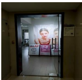
美妆 拒绝原因：无兴 趣