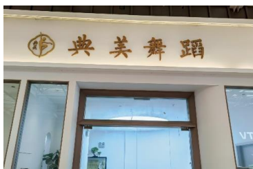
典芙舞蹈 拒绝原因：有专业人员进行推广