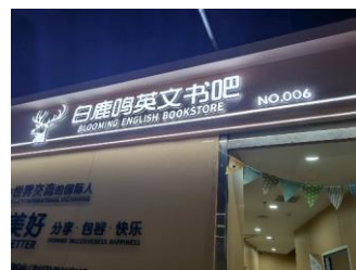
白鹿鸣英文书吧 拒绝原因：不需要