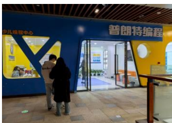
普朗特舞蹈 拒绝原因：不相信学生团队的专业能力