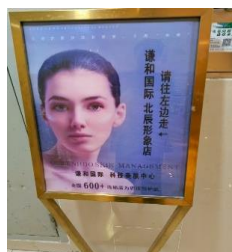
美妆 拒绝原因：不需 要