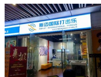
斯迈国际打击乐 拒绝原因：无兴趣