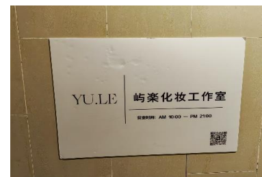
屿秦化妆工作室 拒绝原因：添加了微 信、需要看到作品再 给予答复