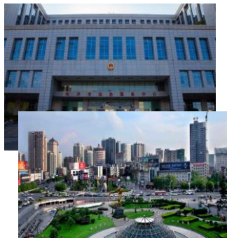
芙蓉区政府 芙蓉广场