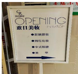
兹日美甲 拒绝原因：无兴 趣