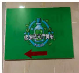
美甲 拒绝原因：有专 业人员进行推广